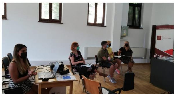
Partenerii au analizat al doilea produs intelectual.

În perioada 26-27 iulie, partenerii proiectului au participat la întâlnirea internațională din cadrul proiectului „Abilități de conștientizare și prevenire a hărțuirii și a discursului violent pe internet la copiii de vârstă școlară” – CyberAware“, nr. 2020-1-LT01-KA201-077819, unde au împărtășit rezultatele deja disponibile ale activităților proiectului și au discutat în detaliu planul de implementare, au pregătit raportul intermediar, au prezentat raportul de diseminare și idei pentru activitățile ulterioare. Întâlnirea a fost productivă, iar comunicarea dintre parteneri a avut loc față în față, fapt ce a adăugat o mare valoare întâlnirii.